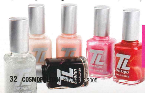
Hele kolleksjonen. Her kan vel de fleste finne en farge de liker... Pris kr 119 pr. stk.