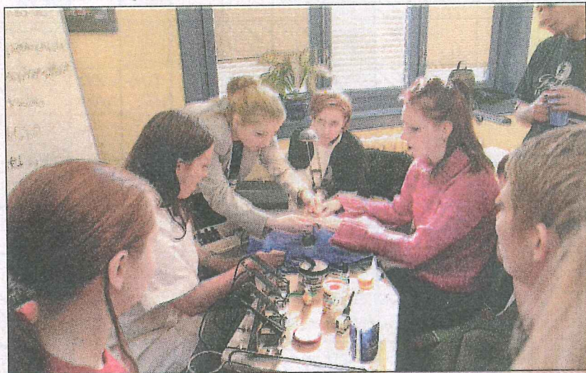
Undervisningstime på Tone Lise Akademiet.

– Fordelen med å være et såpass lite firma er at vi kan planlegge og gjennomføre en ny kolleksjon på tre måneder. Det kan ikke de store huse- ne konkurrere med. Det har vært kjempeviktig når det gjelder det kjappe svingningene i motebildet ellers. Men vi har også merket svingningene i markedet. Som etter 11. september - da ble folk litt tilbakeholdne med å bruke penger på seg,