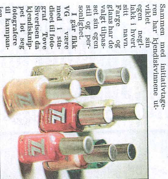
GLITTER OG GLANS: Kjendiskvinnene har utviklet hver sin negllakk, og har valgt farge og glans selv.

Når den celebre kolleksjonen lanseres i slutten av oktober, vil alle hantlene minus produktjonskostnader gå til hjelpeorganisasjonen ROSA – det eneste bistands- og beskyttelses tilbudet i Norge for kvinner utsatt for menneskehandel.